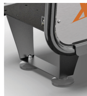
Stabilizing rubber feet version Модель с противовибрационными опорами