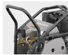
Reversible handle Реверсивная рукоятка