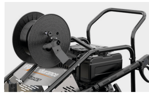
15/20 mt hose reel kit (on request) Комплект наматывателя шланга 15/20 м (по заказу)