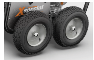
Version with \phi 300 mm 4 pneumatic wheels + brake Версия с 4 пневматическими колесами \phi 300 мм + тормоз

FOR MORE INFO: ДОПОЛНИТЕЛЬНАЯ ИНФОРМАЦИЯ: