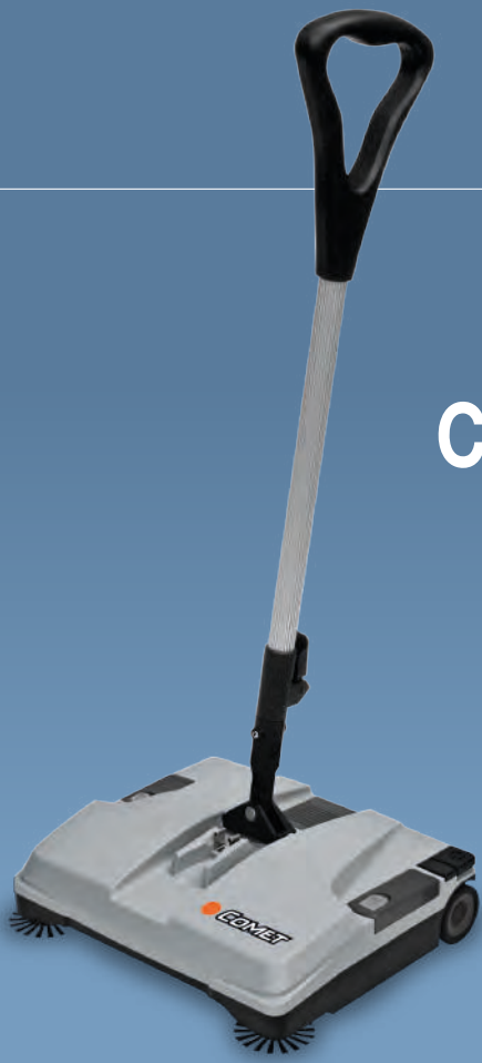
CSW 375 B