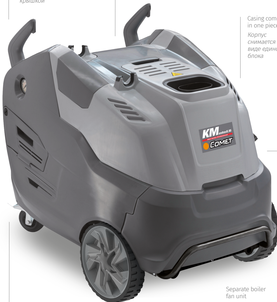
Casing comes off in one piece