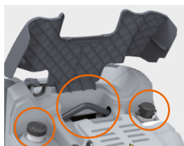
Casing with liftable cover Корпус с подъемной крышкой