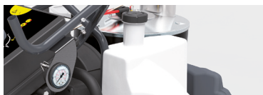
Separate boiler fan unit