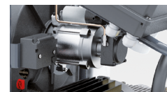
Блок вентиляции с независимым котлом

FOR MORE INFO: ДОПОЛНИТЕЛЬНАЯ ИНФОРМАЦИЯ: