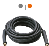
10 m rubber delivery hose kit Комплект резинового шланга подачи 10 м