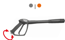
GH 301 gun with Swivel Пистолет GH 301 с шарниром