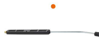
Bent lance with nozzle holder, without nozzle Угловая труба с насадкой для форсунки, без форсунки