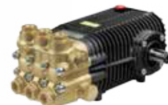
SW / TW Premium