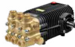
SW / TW Premium