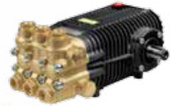
SW / TW Premium