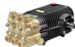
SW / TW Premium