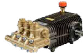
TW 500 Premium