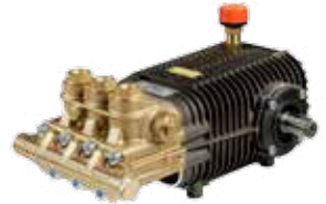
TW 500 Premium