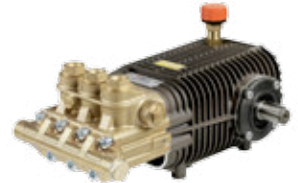
TW 500 Premium