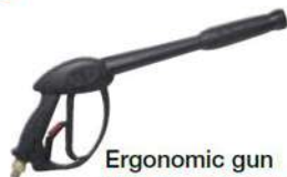
Ergonomic gun (for Classic models only) Pistola ergonomica (solo per modelli Classic)