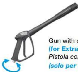
Gun with swivel (for Extra models only) Pistola con swivel (solo per modelli Extra)