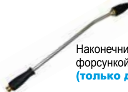
Наконечник с поворотной форсункой (только для моделей Extra)