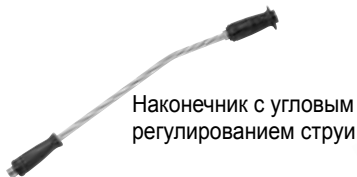
Наконечник с угловым регулированием струи