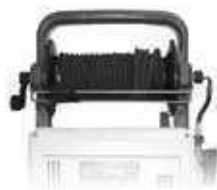
Наматыватель шланга со шлангом высокого давления 10 м (только для модели CLASSIC) 20 м (только для модели EXTRA)