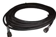
20 mt delivery hose kit with quick coupler M24x1,5 DKO Комплект шланга подачи 20 м, с быстрыми соединениями M24x1,5 DKO