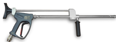
GC 1100 waterblasting spray gun with lance Пистолет с наконечником для водоструйной очистки GC 1100