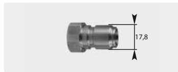
Штекер : IG. Нерж. сталь. Макс. 250 bar / 150 °C