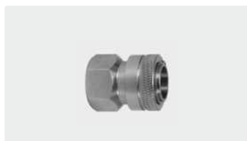
Муфта : IG. Нерж. сталь. Макс. 150 bar / 90 °C