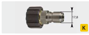
Штекер : IG. Нерж. сталь + латунь. Макс. 250 bar / 150 °C