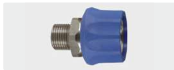
Муфта : AG. Нерж. сталь. 60° упл. конус. Макс. 250 bar / 150 °C