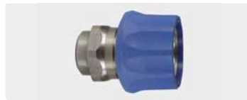
Муфта : IG. Нерж. сталь. Макс. 250 bar / 150 °C