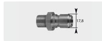
Штекер : AG. Нерж. сталь. 60° упл. конус. Макс. 250 bar / 150 °C