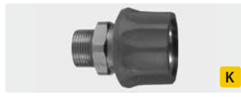
Муфта : AG. Нерж. сталь. Макс. 250 bar / 150 °C