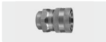
Муфта : IG. Нерж. сталь. Макс. 250 bar / 150 °C