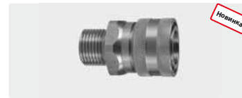
Муфта : AG. Нерж. сталь. 60° упл. конус. Макс. 250 bar / 150 °C